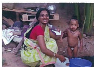
身体をふく清浄水、 洗濯水として