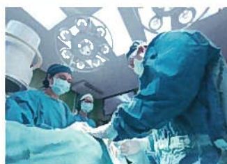
2次感染を防ぐ衛生水 として