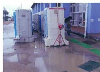
トイレの洗浄水として