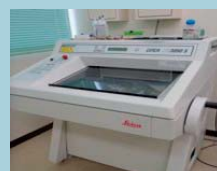
▲ウルトラマイクロームシステム