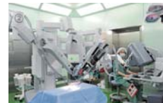
▲医療支援用ロボットダビンチ Si