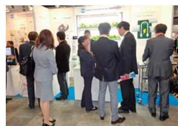
▲展示会出展の様子