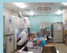
▲組織細胞加工培養室