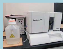
▲蛍光マイクロプレートシステム