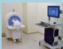
▲小動物用3Dマイクロ線CT