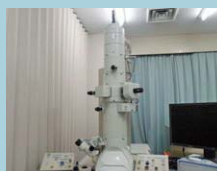
▲透過型電子顕微鏡解析システム