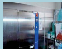
▲低温ガス滅菌装置